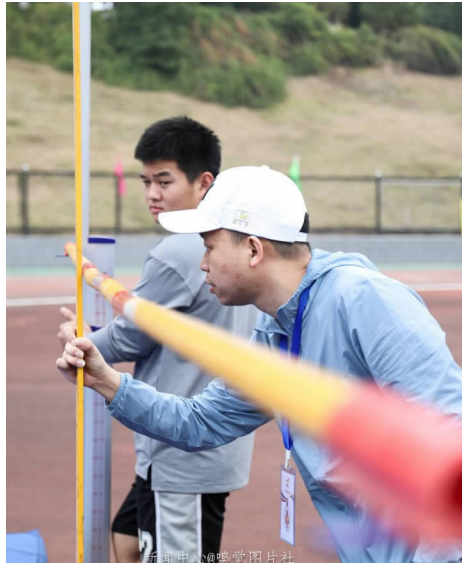
跳高，是田径运动的田赛比赛项目之一，是人体通过助跑、起跳、腾空、落地系列动作形式跳越高度障碍的运动。