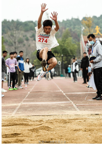
沙坑跳远技术分为4个要点：助跑，踏跳，空中姿态，落地。