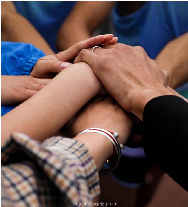
手与手之间蕴含了团结一心，奋勇向前的力量！

砰！发令枪响，运动员们像离弦的箭一样冲了出去4×400米接力赛跑，在跑道上进行，由4名运动员组成一队，每人各跑100米距离的接力赛跑。第一棒运动员以右手持棒，采用蹲踞式起跑；第二、三、四棒接棒运动员均采用站立式或半蹲踞式起跑。