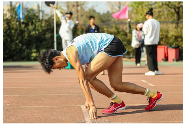
短跑可行的起跑姿势是：前腿保持约90度的角度。处于预备姿势的后腿保持120度的角度。

当短跑运动员进入“预备”姿势时，应该立即抬起臀部使双腿形成理想的起跑角度。头部保持自然姿势，手臂稍微弯曲。1000米中距离跑属于中跑项目，中长距离跑是发展耐久性的项目，长时间的连续肌肉活动，是这个项目的特点。