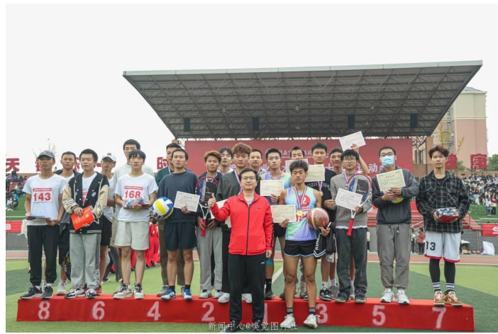
运动员们的获奖合影，比赛结束，每场比赛都有不一样的收获