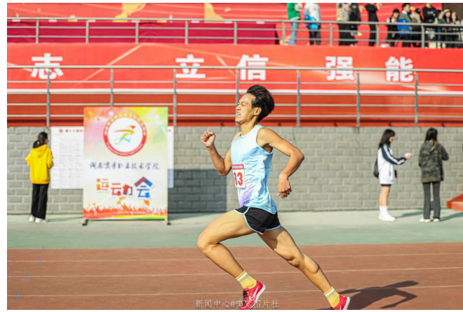
1000米中距离跑属于中跑项目，中长距离跑是发展耐久性的项目，长时间的连续肌肉活动，是这个项目的特点。

当短跑运动员进入“预备”姿势时，应该立即抬起臀部使双腿形成理想的起跑角度。头部保持自然姿势，手臂稍微弯曲。1000米中距离跑属于中跑项目，中长距离跑是发展耐久性的项目，长时间的连续肌肉活动，是这个项目的特点。