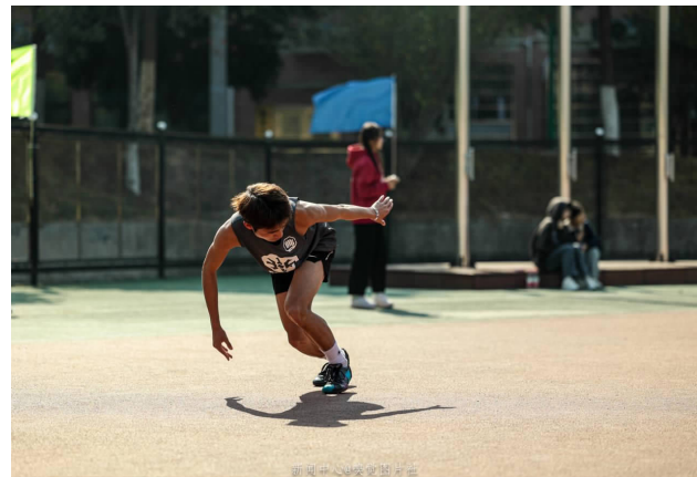
4×400米接力赛跑，在跑道上进行，由4名运动员组成一队，每人各跑100米距离的接力赛跑。第一棒运动员以右手持棒，采用蹲踞式起跑；第二、三、四棒接棒运动员均采用站立式或半蹲踞式起跑。