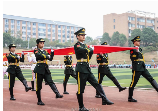
国旗护卫队擎着鲜艳的红旗，身着整齐的制服，迈着矫健的步伐向我们走来了铅球是利用人体全身的力量，将一定重量的铅球从肩上手臂推出的田径运动项目之