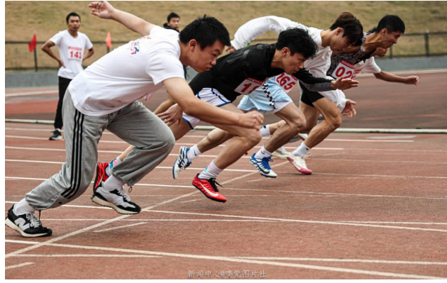
田径男子100米，是奥运会田径比赛的重要赛事之一。